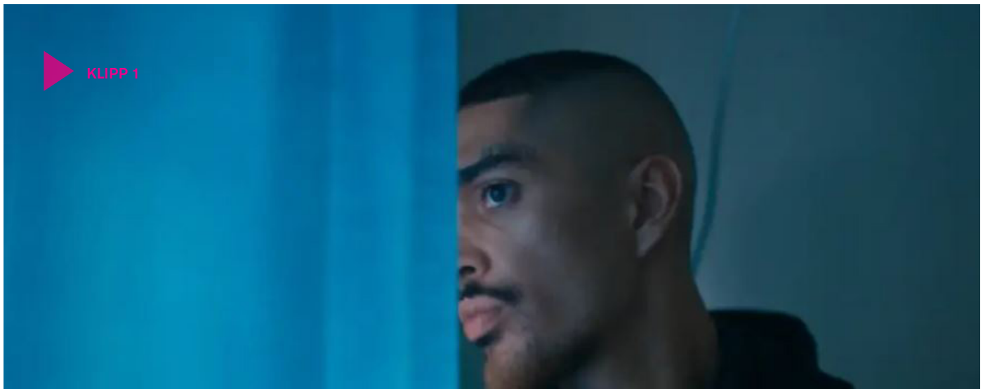
Klipp 1