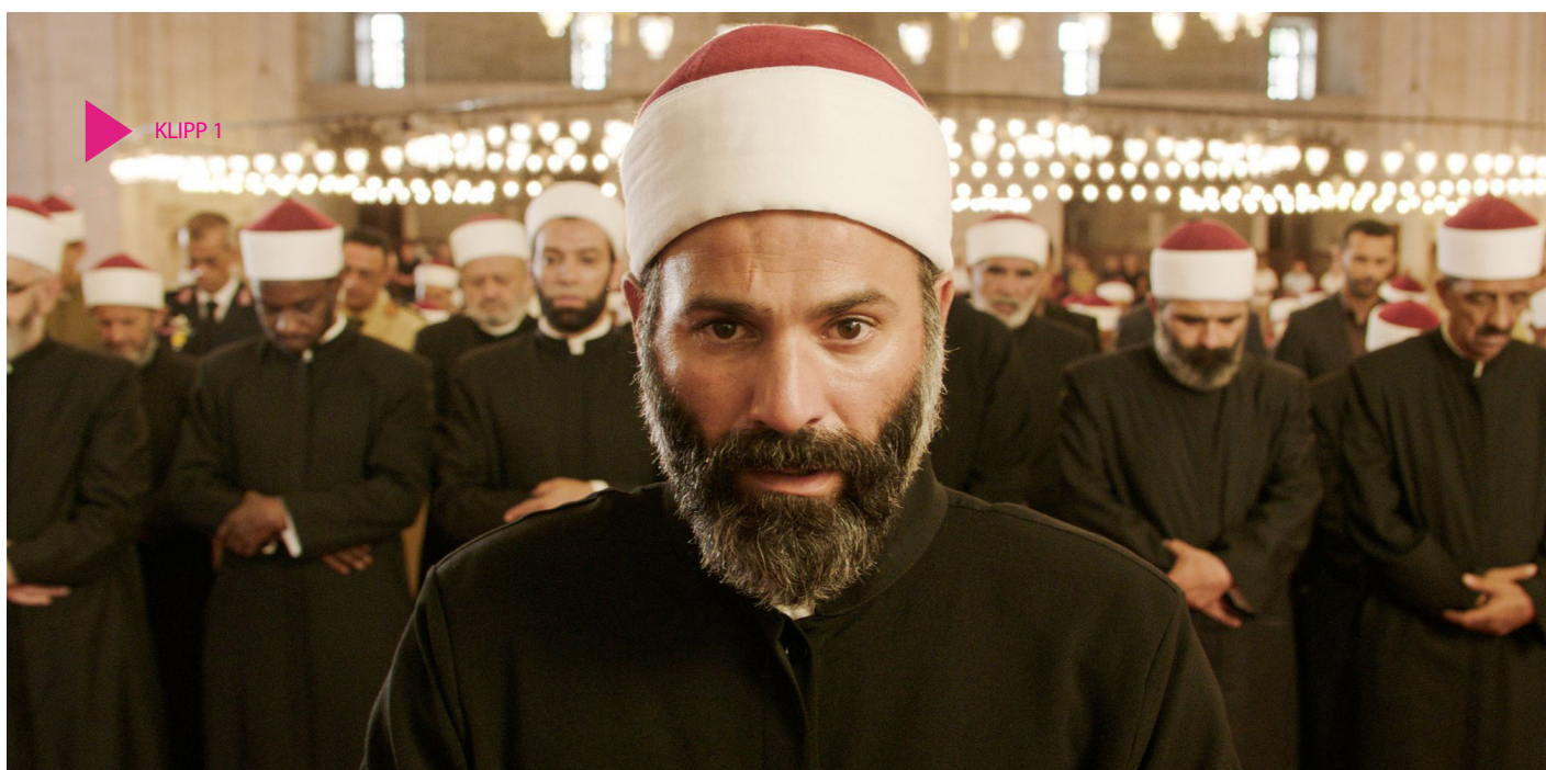
Trailer till Boy from Heaven

Adam har knappt hunnit anlända till universitetet förän sittande Sheikh Al-Azhar dör, och arbetet med att utse en ny börjar. Processen sköts på pappret internt, men vid den egyptiska säkerhetspolisen börjar man