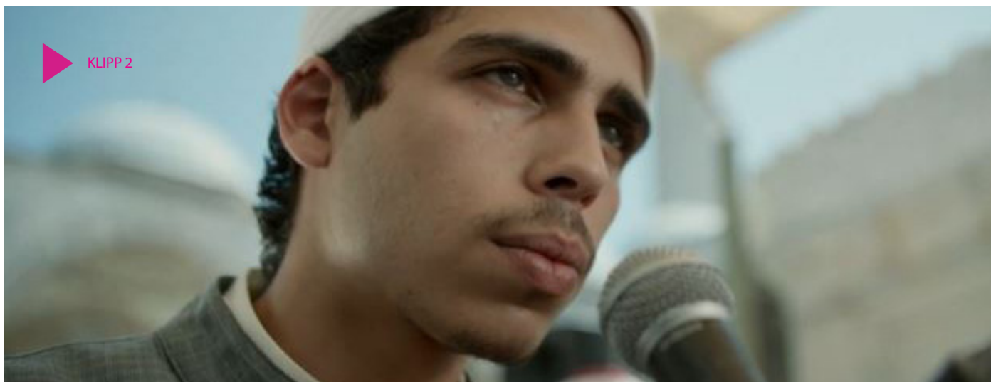
Klipp 2