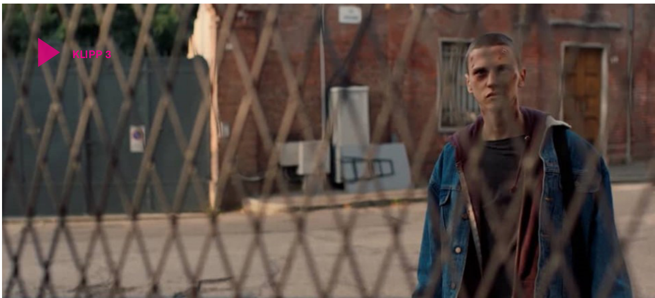
Klipp 3