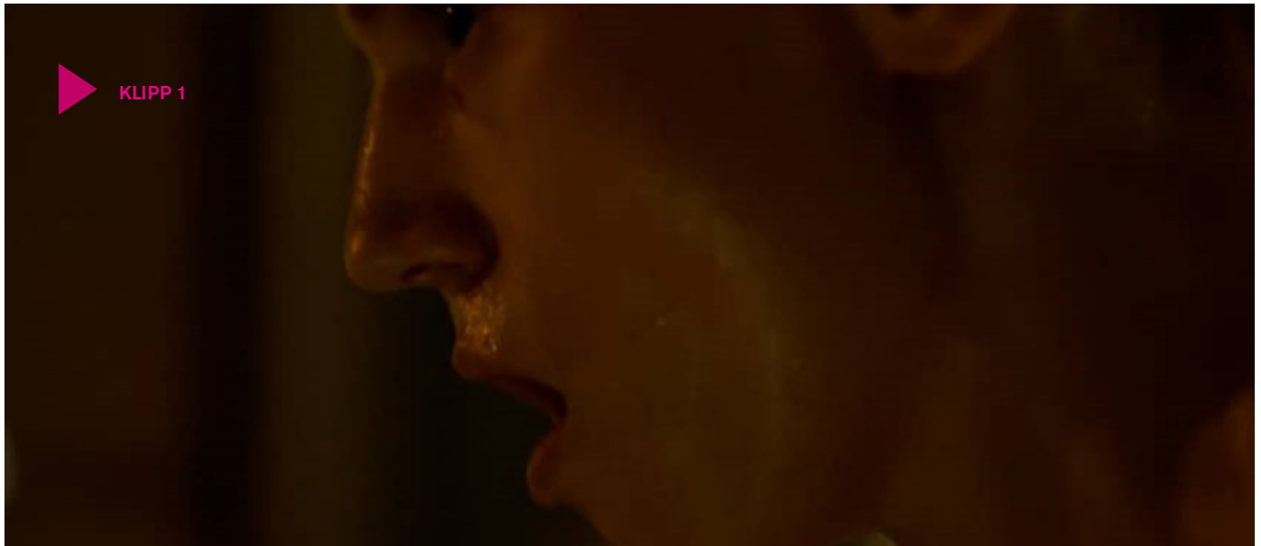
Klipp 1

• I boken hämtas Martin hem av sin familj efter sin sjukhusvistelse och han får hjälp av en terapeut att hitta tillbaka. I filmen stannar han kvar, innan han själv bestämmer sig för att ge sig av. Diskutera gärna vad de olika slutet kan betyda och varför ni tror att filmen har valt sitt slut.