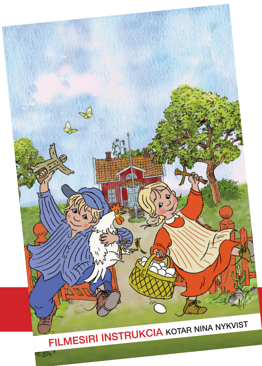
FILMESIRI INSTRUKCIA KOTAR NINA NYKVIST